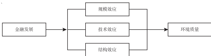
图1 金融发展影响环境质量的机制路径

首先,金融发展影响环境的规模效应。金融作为现代经济发展的核心,良好的金融发展水平有助于扩大经济规模、影响能源消费,从而改变环境质量。从生产角度来看,金融发展增加企业融资渠道,降低企业融资成本,有效解决企业面临的资金约束问题,有助于扩大生产规模,优化企业投资决策等,进而刺激能源消费,尤其在当前中国以煤炭为主的能源结构下,会增加污染排放;从需求角度来看,金融发展降低消费者私人借贷成本,使其更容易获取用于耐用消费品(如空调、洗衣机等)购买的资金,而需求增加刺激生产,扩大经济规模,增加更多原材料、能源等需求与消费,导致污染物排放增加(Sadorsky, 2010; Zhang, 2011)。其次,金融发展影响环境的技术效应。稳定的金融发展环境有利于降低融资成本,降低企业技术研发创新的风险,鼓励企业增加研发创新支出,促进技术进步,提高生产效率,降低单位产出能源消耗,或者使用替代性清洁能源与生产替代性清洁产品等,从而减少污染排放,改善环境质量;良好的金融发展有助于深化对外开放,如吸引外资等,以资金、技术等为主要形式的外资所带来的技术溢出效应,是工业化阶段中国提升产业技术的重要途径(金碚, 2015)。但需要指出的是,中国银行体系中的国有大银行特征,可能导致金融机构偏向于为国企提供信贷,融资政策也向大中型国有企业倾斜,却对具有较高效率的私企存在信贷歧视(陈刚、李树, 2009);再加上现阶段区域发展不平衡现状与“重增长轻环境”的特点,尤其在中西部待发展地区,金融发展可能导致金融资源投放集中于粗放型生产技术,而非用于节能减排技术,这些因素可能不利于绿色技术进步。也就是说,金融发展既可能促进粗放型技术进步而导致能源消耗与污染排放增加,也存在提高绿色技术进步,从而改善环境质量的可能性。因此,金融发展影响环境的技术效应是不确定的,有待结合中国经验事实与数据进一步实证检验。最后,金融发展影响环境的结构效应。金融发展能够影响资源在产业间的转移与分配,尤其在发展中国家较低发展水平、产业间资源分配不均的背景下(顾永昆、刘永甜, 2017)。当前中国整体仍处于工业化时期,尤其中西部省份甚至在初期阶段,国家为加快工业化进程可能将金融资源集中于工业,尤其重工业部门,而抑制服务业等清洁型行业发展(陈斌开、林毅夫, 2012; 王勋、Johansson, 2013)。近几年,中国产业结构服务化倾向明显,自2012年以来,第三产业GDP已超过其他产业,成为中国最大产业,同时服务业也是金融资源投放的重要领域。 ④ 因此,良好的金融发展水平可能有助于资源流向服务性清洁行业等,进而改善环境质量。基于上述分析,本文提出以下研究假说: